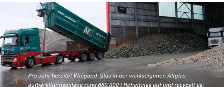
Pro Jahr bereitet Wiegand-Glas in der werkseigenen Altglasaufbereitungsanlage rund 660.000 t Rohaltglas auf und recycelt es.

Nach dem Kühllofen durchläuft jede Flasche zu 100 % eine Reihe automatisierter Qualitätsprüfungen. Sind die Mündungen dicht? Werden die Parameter von Wand- und Bodenstärke eingehalten? Passt das Verhältnis zueinander und ist die Verteilung im Glas gut? Ist das Glas konkav oder konvex, rund und nicht eckig? Stress im Glas wie Kratzer, Einkerbungen oder Spannungen werden über die Ultra-HD-Kameras erfasst. Obwohl diese Prüftechnik eine große Investition darstellt, tauscht Wiegand-Glas bei jedem Glaswannen-Neubau, der turnusmäßig rund alle zehn Jahre vorgenommen wird, auch die komplette Prüftechnik aus, um immer die neueste Prüftechnik im Einsatz zu haben und somit weiter Benchmark zu sein. Erklärtes Ziel: Mit bestmöglichen