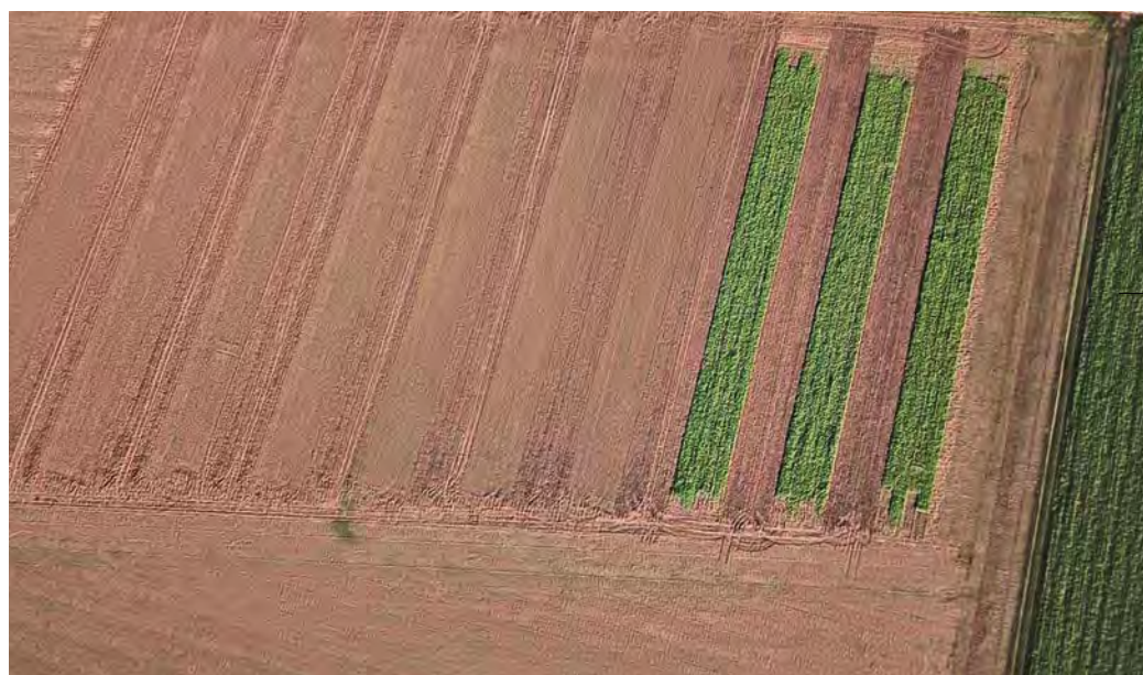
Im November ist der Streifen-Versuchsaufbau schon aus der Luft zu erkennen. Deutlich zeigen sich die Zwischenfrüchte (rechts) und auch das Wintergetreide (links) entwickelt sich vegetationsgerecht.