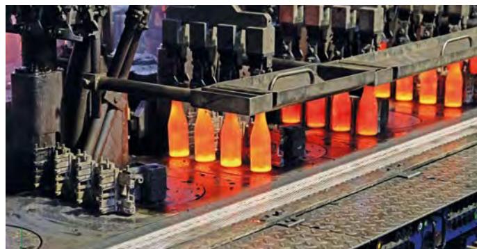
Heißer Arbeitsplatz: rotglühend kommen die frisch geblasenen Weinflaschen aus der Glasform.

Damit wird die Effizienz des gesamten Verbrennungsprozesses erhöht. Aus der Schmelzwanne kommend werden die Glastropfen in einem zweistufigen Prozess zur fertigen Glasflasche aufgeblasen.