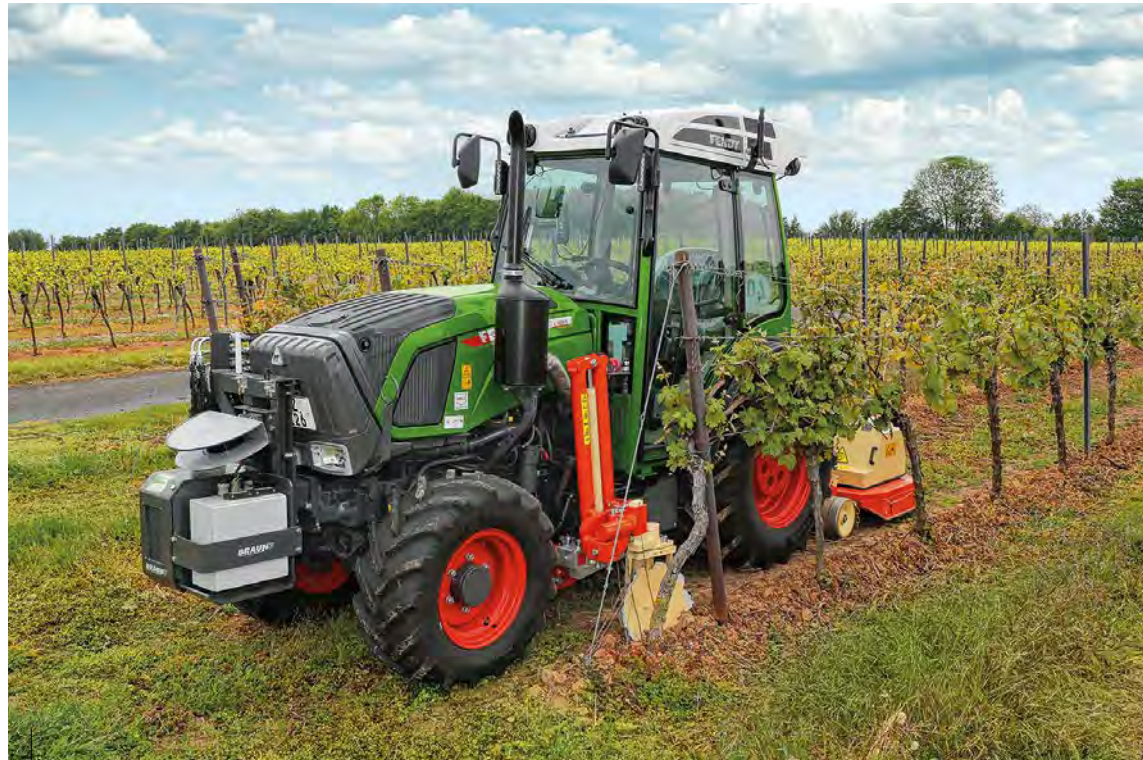
Die volle Funktionalität von VPA ist exklusiv nur mit einem Fendt 200 Vario möglich.

Mit der VPA-Geräteführung gehört anstrengendes Multitasking vom Schlepperfahrer – exaktes Lenken bei gleichzeitiger Überwachung und Steuerung der Anbaugeräte – bei der mechanischen Unterstockbearbeitung der Vergangenheit an. Denn bei der VPA-Geräteführung werden mittels modernster Lasertechnik Parameter wie Bodenkontur, Rebstöcke oder Pfähle erfasst. Mit einem Gyroskop, einem schnell rotierenden Kreisel, wird zudem die 3D-Position ermittelt. Diese Informationen werden über eine ISOBUS-Schnittstelle an den Schlepper weitergegeben, welcher die Spur- und Geräteführung übernimmt – exakt in der Mitte der Rebasse. Links und rechts angebaute Zwischenachsarbeitsgeräte können unabhängig voneinander in Höhe und Breite gesteuert werden. Die Geräte arbeiten so in optimalem Abstand zu den Rebstöcken, wodurch die Arbeitsqualität verbessert und Beschädigungen nahezu ausgeschlossen werden. Das System kann auch für die Seitenführung von Heckmulchern verwendet werden.