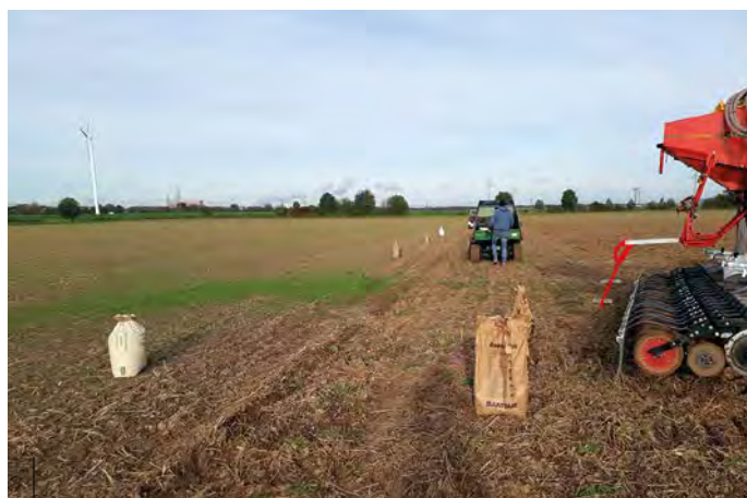
Im Oktober erfolgte die Aussaat der unterschiedlichen Winterungen.